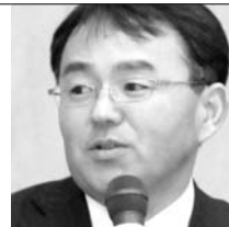
(株)ら・さんたランド 代表取締役社長

シリーズ累計50万部突破したビジネス書「日本ていちばん大切にしたい会社2」で掲載される。