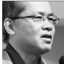
一般社団法人 政経連合総研 理事長 林塾「政治家天命講座」 主宰