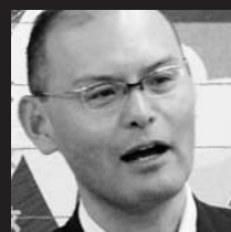
名古屋眼鏡(株) 代表取締役社長

専門分野は経営革新支援、人材育成プランニング・指導、経営者・管理者及び各階層別能力開発、心を鍛えるセミナー、業種別接客接客研修、起業家支援、まちづくり指導。「新潟江戸しぐさ研究会」代表。