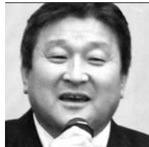
(株)エコネコル 代表取締役社長

現在、経営者・政治家・学生・青少年など幅広い層を対象に、年間約150回の講義・講演をこなす。また、「政治家天命講座」を主宰して、国を担う志士政治家を育成し、その中から2名の市長が誕生。卒業生の多くが国は担当地方議員として育ち、日本改新を推進する若手政治家グループとして注目を集めている(平成の龍馬1000人構想)。文明論や大和言葉、中国思想などをベースに、志の高い経営者や政治家を生んでいる林哲学は、「綜學」と呼ばれる全体学である。