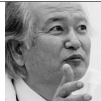
(株)沖繩教育出版 代表取締役社長